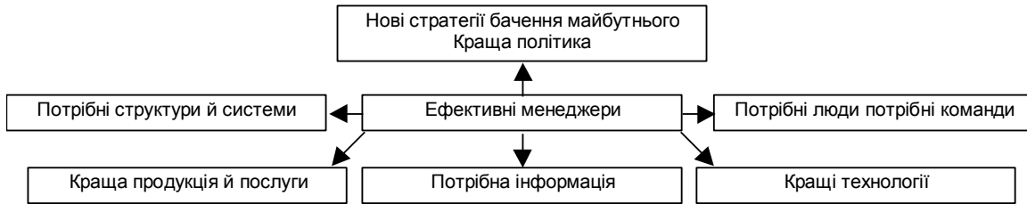
Рис. 1. Компоненти сучасного менеджменту

гічна політика без керівників, які можуть її реалізовувати, недосяжна, оскільки це досить складний процес, що вимагає кваліфікованого управління. На рис. 1 подано найважливіші компоненти ефективного менеджменту [5, с. 173].