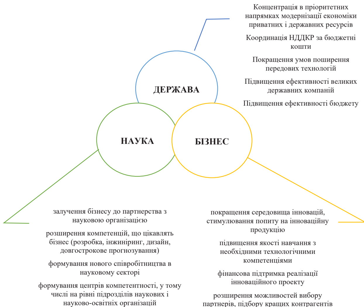
Рис. 1. Схема інтеграції держави, бізнесу та науки у процесі реалізації державно-приватного партнерства

Ініціювати проект державно-приватного партнерства може як приватний, так і держав-