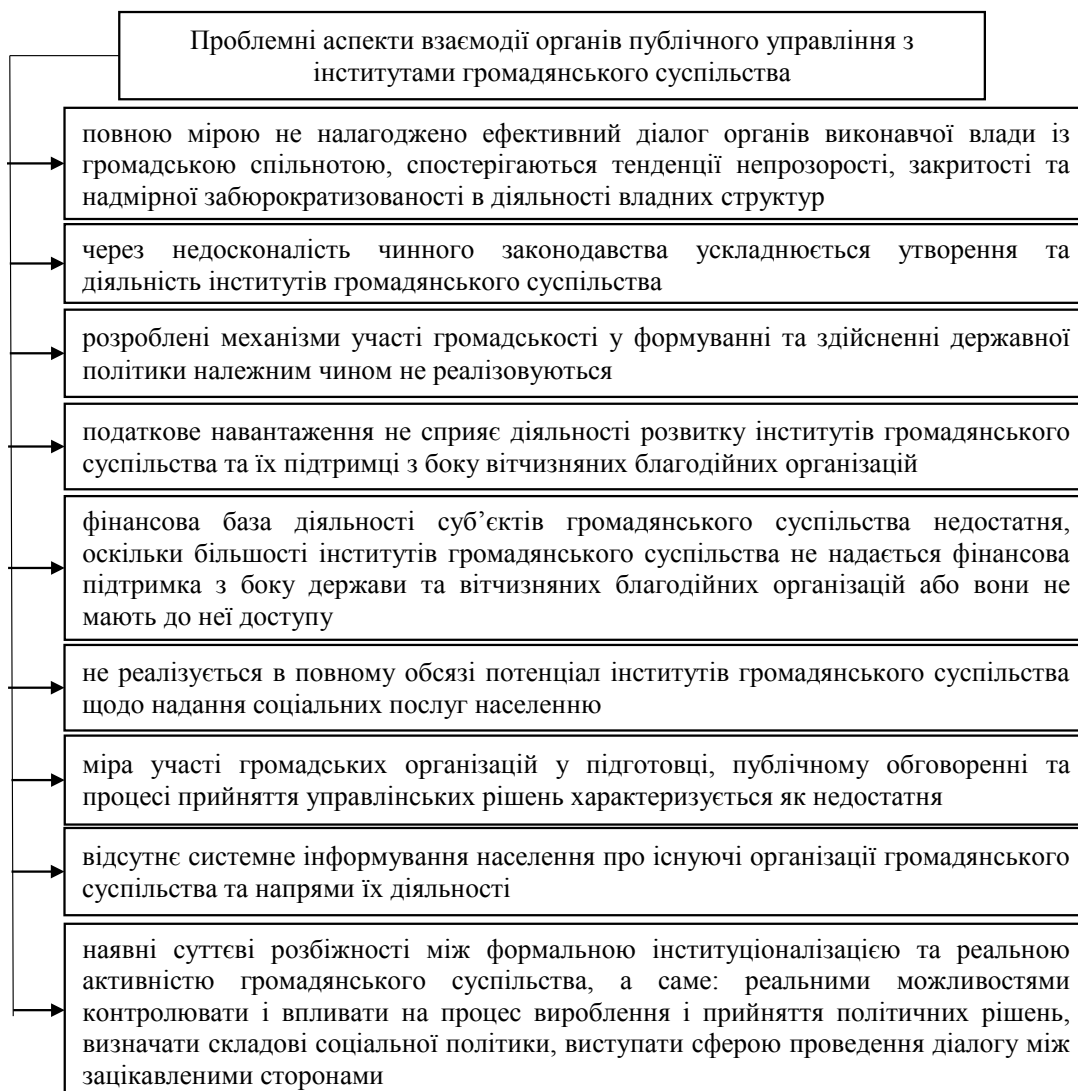
Рис. 1. Проблемні аспекти взаємодії органів публічного управління з інститутами громадянського суспільства

Під державно-громадянською взаємодією розуміють позитивні форми, які відображають пошук спільного поля діяльності і передбачають досягнення консенсусу обома сторонами.