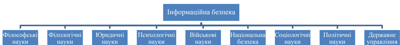
Рис. 1. Науки, предметом дослідження яких є інформаційна безпека

Аналіз останніх досліджень і публікацій. На підставі аналізу дисертаційних досліджень, захищених на пострадянському просторі (Україна, Білорусія, Російська Федерація, Вірменія, Казахстан, Таджикистан) за період 1997–2015 рр. [1–20] можна зробити висновок про те, що проблеми забезпечення інформаційної безпеки сьогодні привертають увагу дослідників різних соціально-гуманітарних напрямів. Окремі аспекти інформаційної безпеки стали предметом наукових досліджень у галузі, філософії, історії, політології, соціології, юридичних наук тощо (рис. 1.).