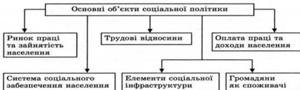
Рис. 2. Об'єкти соціальної політики

Методи здійснення соціальної політики, або інструменти впливу держави на розвиток соціальної сфери можна охарактеризувати таким чином: