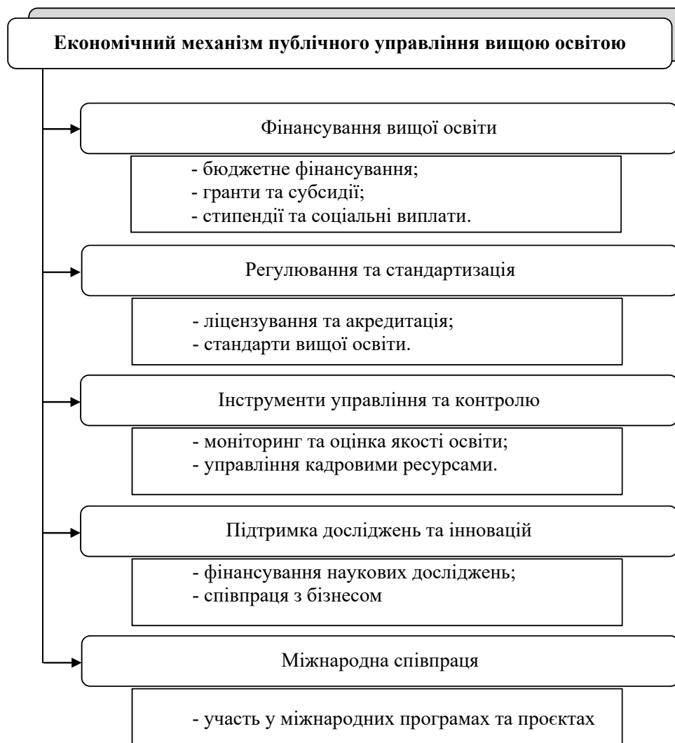
Рис. 2. Складові економічного механізму публічного управління вищою освітою