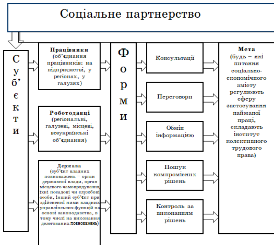
Рис. 1. Соціальне партнерство як інструмент регулювання трудових відносин

ДПП є співпраця між державою та приватним сектором, яка здебільшого зосереджена на інфраструктурних проектах, де традиційно існує потреба та можливість для ефективного партнерства. Зазвичай, ДПП передбачає залучення приватного капіталу з частковою передачею прав на операційне управління об'єктами інвестицій на визначений період. Конкретні форми такої співпраці залежать від особливостей національного ринку та правової системи.