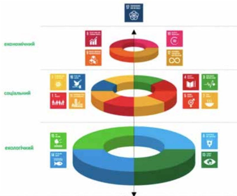
Рис. 1. Ієрархія 17 Цілей сталого розвитку у контексті впливу на здоров'я та добробут населення