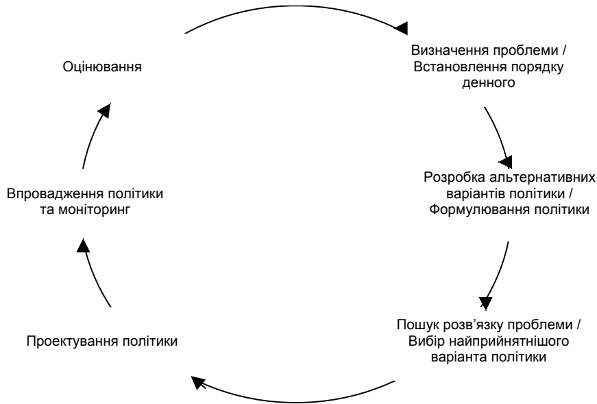
Рис. 1. Циклічна модель політики

українські, так і зарубіжні науковці, називається циклом політики (рис. 1). Вони наголошують на тому, що перевагою циклічної моделі політики є її здатність бути орієнтиром, а недоліком – брак гнучкості.