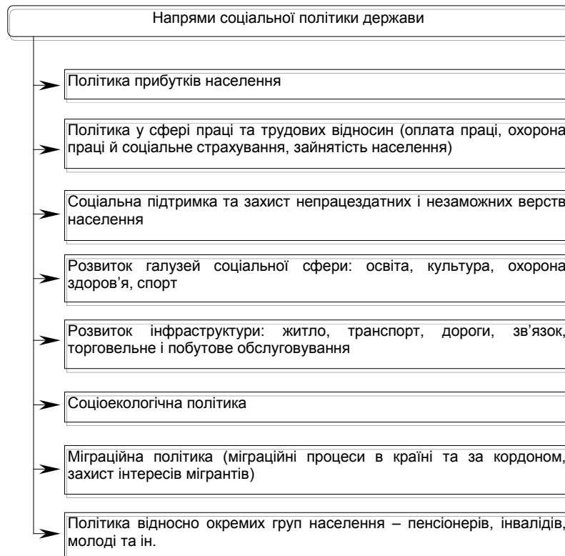
Рис. 1. Основні напрями соціальної політики держави

У кожній сфері (напрямі) соціальної політики держави в рамках наведених методів державного управління може бути розроблений ряд вузькоспеціалізованих інструментів, спрямованих на досягнення поставлених цілей. Самі інструменти можуть відрізнятися за рівнем економічності й результативності, за мірою організації або самоорганізації соціальної системи в процесі досягнення цілей.